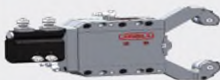
跟刀中心架 (滾輪型/車削用)