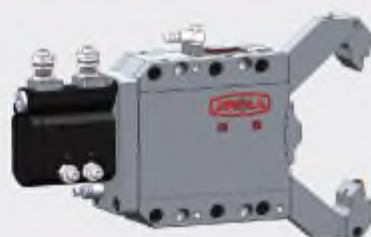
跟刀中心架 (支撐片型/磨削用)