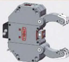
車床中心架 (內藏油缸型)