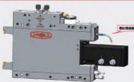
四代磨床中心架 (雷射感應型)